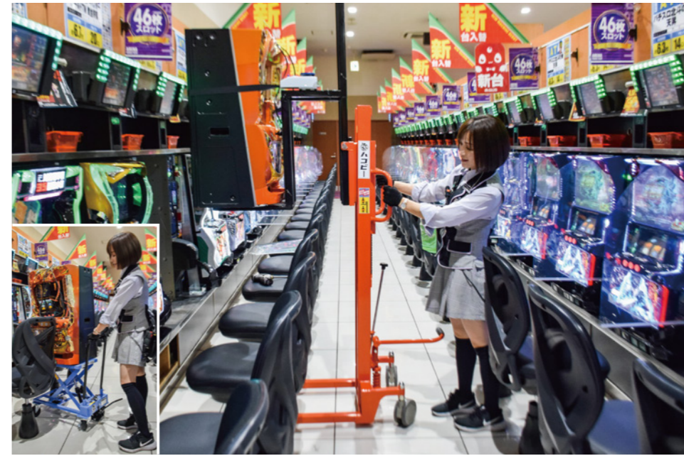
油圧式のレバーで遊技機の上げ下ろしを行うことで、力を使わずとも入替作業が行える「ハコビー」。製品に遊技機を乗せ、イスの真後ろからそのまま設置できる「〜レッド」(上記写真「大」と、イスとイスの間に入れ設置する「〜ブルー」(上記写真「小」)のほか、遊技機の運搬用として、電動式で階段での移動などをサポートする「〜ブラック」を取り揃えている。

「腰痛や遊技機の破損といったリスクが軽減したことも大きい。嫌な業務が減ったことで、従業員の仕事に対するモチベーションアップにも繋がっています」。